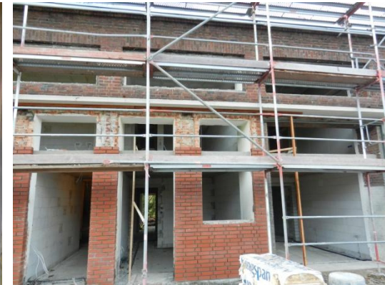
Haus 2b Verlegearbeiten von Strom und Wasser, Dämmarbeiten und die Außenfassade wird verklindert