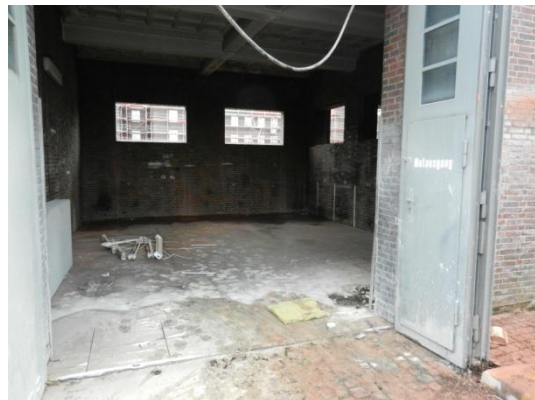
Haus 12 Entkernungsarbeiten