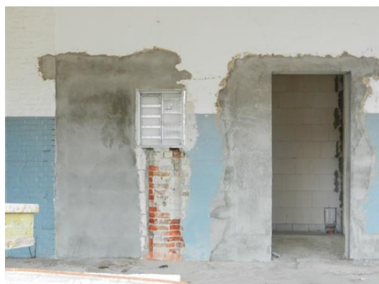
Haus 6 Außenansicht und Innenarbeiten